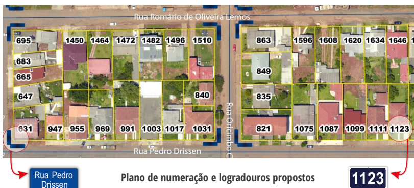
Plano de numeração e logradouros propostos

A partir de 2019, a Prefeitura confeccionará e afixará placas de logradouros em cada esquina da cidade. Também, anexará ao boleto do IPTU a Certidão de Endereço de cada imóvel.