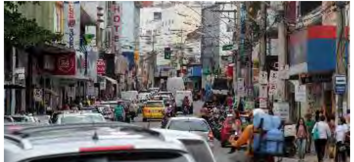
Trânsito na região central da cidade de Pará de Minas, em Minas Gerais