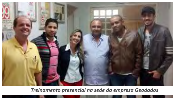
Treinamento presencial na sede da empresa Geodados

A Geodados oferece várias opções de suporte e capacitação, além da assessoria facilitada, onde a prefeitura recebe pronto atendimento. Telefone, e-mail e até mesmo Skype e WhatsApp são utilizados para uma comunicação imediata. Existem três tipos de treinamento, o presencial realizado na sede da empresa; presencial na própria prefeitura e via comunicação remota. Neste caso, servidores com acesso à internet tem acesso às imagens e explicações pelo computador em tempo real. Para simplificar a utilização dos programas os servidores recebem além do manual impresso e digital, um headfone para o contato remoto.