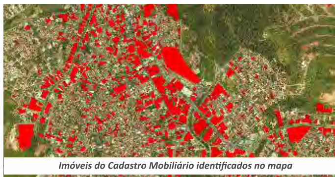
Imóveis do Cadastro Mobiliário identificados no mapa

Foram confrontados os dados referentes aos ramos de atividade, endereço e publicidade. Em outra etapa do trabalho e por meio da fotointerpretação, que auxilia na identificação dos pontos comerciais, industriais e prestadores de serviços, foram encontrados 3.834 novos estabelecimentos. Todas as unidades que apresentaram divergências foram listadas e apresentadas à administração pública municipal para inspeção de campo.